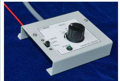
リモートコントローラ